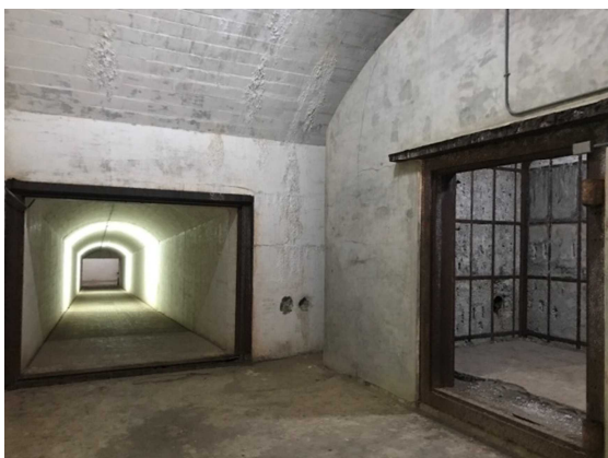
第2弾薬庫跡及び連絡通路跡