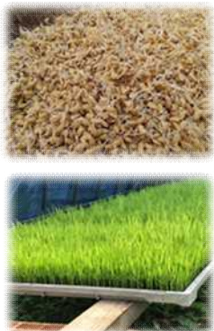
～令和3年度田植え体験の様子～