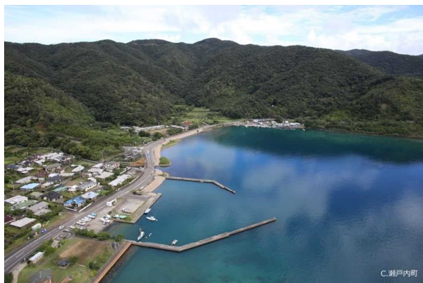
大島需品支庫跡（全景）