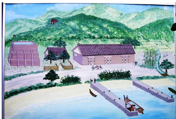
大島需品支庫跡（集落民による復元図）