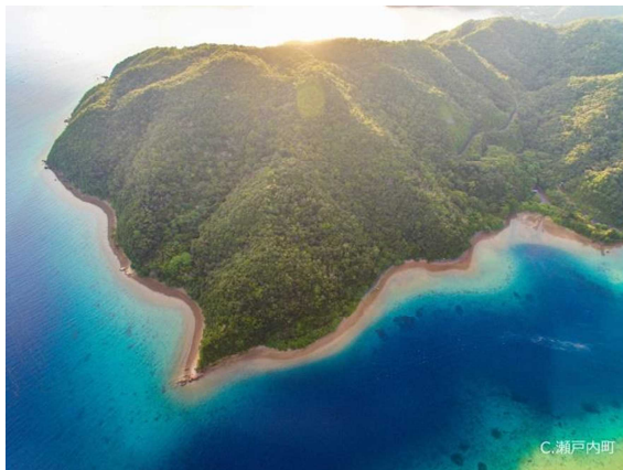
第18震洋隊基地跡（全景）