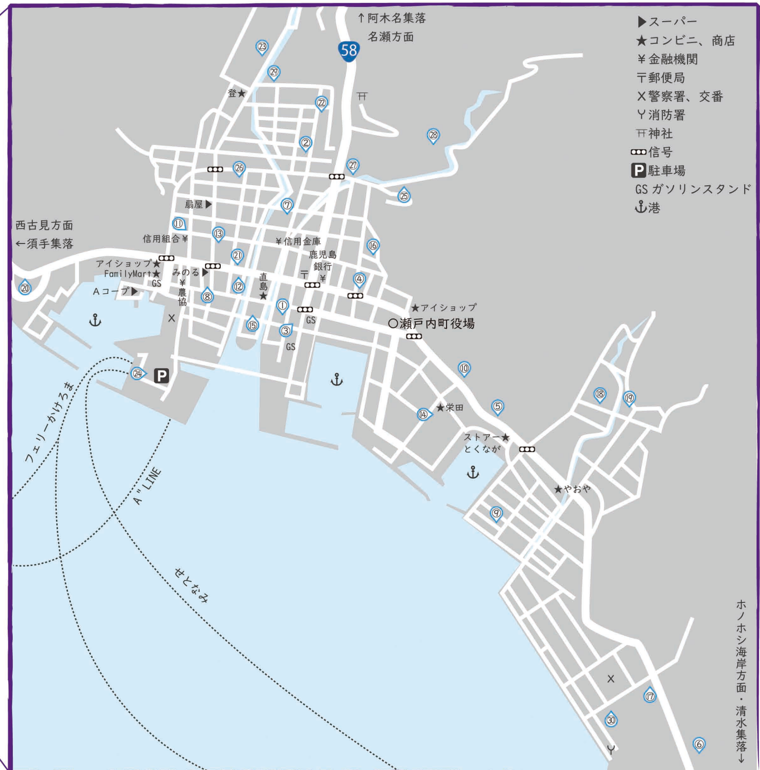
古仁屋市街地詳細図