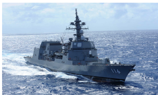
護衛艦(あきづき型)

基準排水量200t 乗員約10名 長さ35m 幅8m 深さ1.5m 速力18kt