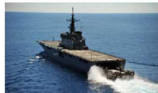
輸送艦(おおすみ型)

基準排水量5,050t 乗員約200名 長さ151m 幅18.3m 深さ10.9m 速力30kt