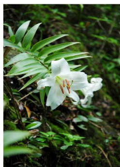
大山に咲くウケユリ

毎年梅雨のこの時期、岩陰でカサブランカに似た大輪の花をつけるのが「ウケユリ」です。以前は町指定の文化財（天然記念物）でしたが、その希少性が評価され、平成20年4月には、請島（大山）に自生するウケユリが、県の天然記念物として指定されています。