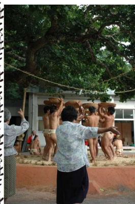
県指定無形民俗文化財 「油井の豊年踊り」

日時: 9/12(日) 10:45~ 場所: 図書館1階絵本コーナー 絵本・紙芝居のほかにも、ちいさい子も楽しめる手遊びなど、いろいろなプログラムを用意しています♪ 読み聞かせなどのボランティアも随時募集中です♪ 興味のある方は図書館職員にお声かけください!