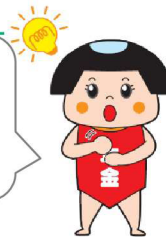
ねんきん太郎 「ねんきんネット」マスコット