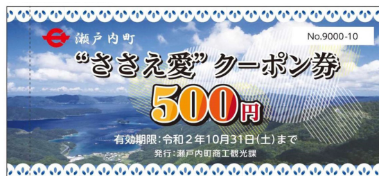
↑前回ささえ愛クーポンイメージ図 ※今回のデザインとは異なります

郵送します。 ■ 郵送時期 令和3年4月末を目途に、レターパックプラス（対面での直接受取）にて郵送します。 郵便局からの不在通知が入っていた方で、郵便局窓口受取を希望される方は、平日の5時までに郵便局窓口の受取にご協力ください。 ■ 注意事項 ▽対象店舗でのみ使用可▽転売、現金との引換え、及びその他のものとの交換不可