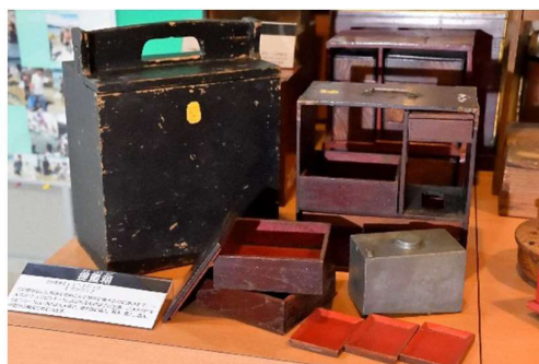
「ピントジユウ」や「サゲジユ」と呼ばれていた提重箱

まもなくサンガツサンチ(旧暦3月3日)ですね。お弁当を持って潮が引くころ海に行き、貝を採ったり、フティモチ(よもぎ餅)を食べたり。この「提重箱」は、昔のピクニックセット。飯入れや肴入れ、水筒、小皿、お箸などがコンパクトに取っ手のついた箱に収まっています。「海に行かないとカラスになる」との言い伝えがあるこの日。本来は、海で悪いものを浄化する厄除けの意味が隠されているんですよ。