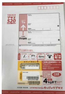
↑こちらのレターパックプラスで届きます

郵送します。 ■ 郵送時期 令和3年4月末を目途に、レターパックプラス（対面での直接受取）にて郵送します。 郵便局からの不在通知が入っていた方で、郵便局窓口受取を希望される方は、平日の5時までに郵便局窓口の受取にご協力ください。 ■ 注意事項 ▽対象店舗でのみ使用可▽転売、現金との引換え、及びその他のものとの交換不可