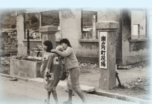
大火で焼失した当時の役場

このような惨禍をもう二度と起こさないためにも、大晦日や年末年始が間近に控える「今」こそ、古仁屋大火から学ぶべきことがあるのではないかと。そう思うと編集にも力が入りました。 この古仁屋大火から火災の恐ろしさや、火の持つ怖さを子ども達を感じ取ってくれていたら、非常に広報紙冥利に尽きます：広報紙冥利？ 乾燥する12月は特に火災が多い時期といわれています。ストーブの消し忘れや火の元の管理には細心の注意を払いながら2021年を迎えていただけたら幸いです。 それでは、12月も皆さんにとって充実した幸せな日々でありますように。