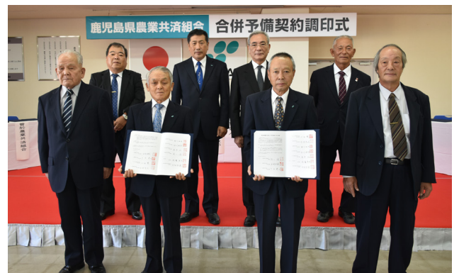
合併予備契約調印式にて

■ 変わらないこと 現在の人員体制、事務所(本所・瀬戸内支所・喜界支所)は変わりません。 合併により加入者の