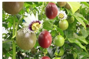
パッションフルーツ