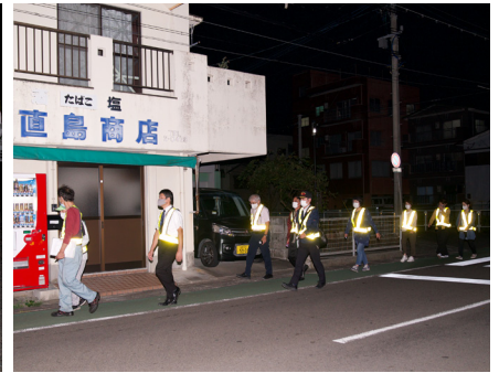
市街地パトロールの様子