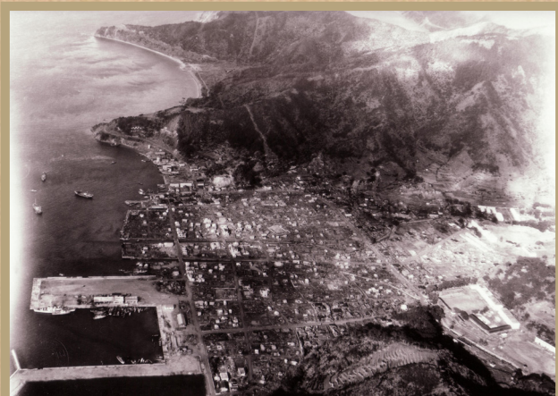
大火翌日の物資輸送にて撮影された航空写真