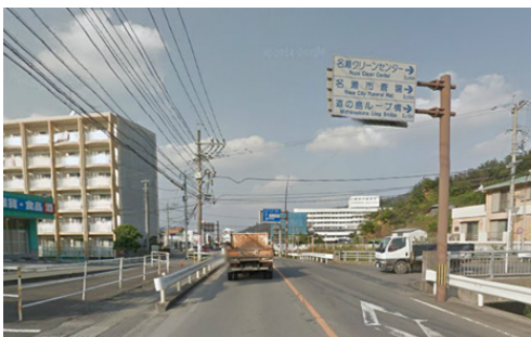
奄美市名瀬平田町方面へ向かい道の島ループ橋を経由してください。 ※国道 58 号線沿いに案内板があります

『困ります、ゴミ出しのルール違反!』 今年も年末の大掃除などで多くのごみが排出される時期となりましたが、町民の皆様から「回収後にごみが出さ