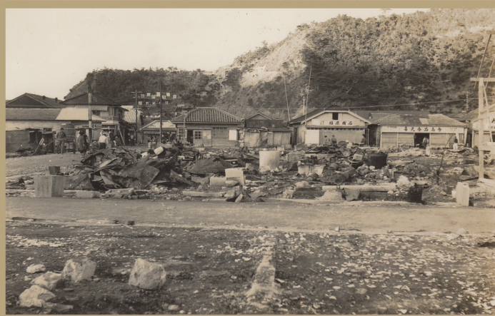
焼け野原と化した古仁屋市街地