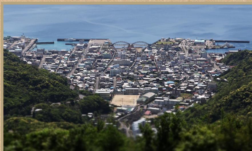
この風景を守っていくためにできることは何だろうか。