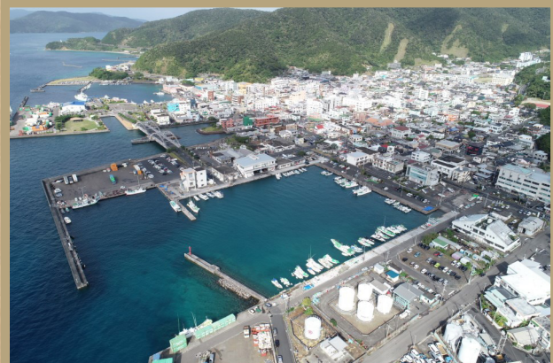
古仁屋市街地の今