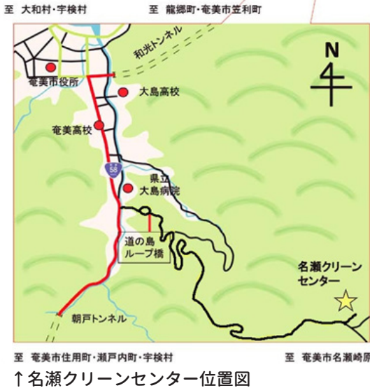
↑名瀬クリーンセンター位置図