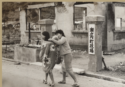
焼失した瀬戸内町役場