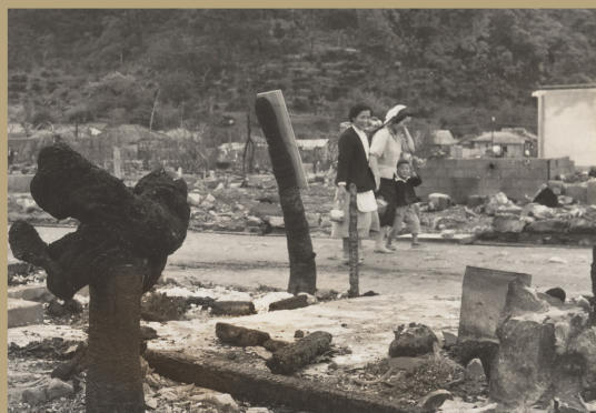
大火翌日の古仁屋