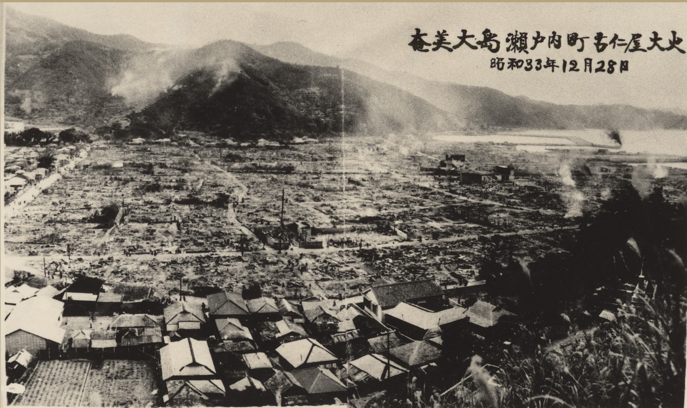
大火後の焼け跡とガレキ

今から62年前の昭和33年12月27日午後11時15分。古仁屋市街地南方にて発生した火事は、風速15mの西風にあおられ、海岸通りから市街地の中心部にみるみる広がり、6時間半にわたり市街地の旧軍用道路を境にした東南部約1600戸を焼き、28日午前6時ごろになつてようやく鎮火するという惨禍が起きました。このため、古仁屋の繁華街は全焼し、市街地の約3分の2が廃塵と化しました。被災者は約7000名。幸いにも死者は「0」。しかし、骨折等の負傷者が1000人近く出ており、燃え盛る炎の傍らで応急処置を受けました。この火災は、鹿児島県内における戦後最大の大火と言われています。ではなぜ、古仁屋大火は街の8割を失うまでに被害が拡大したのか。今月の特集ではその原因に迫ります。