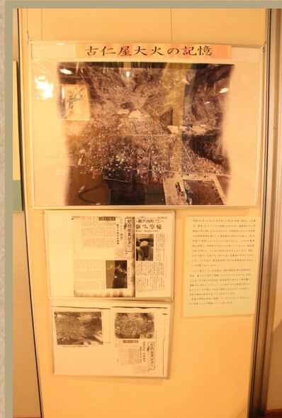
町立郷土館には貴重な資料が展示してあります