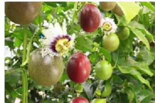
パッションフルーツ