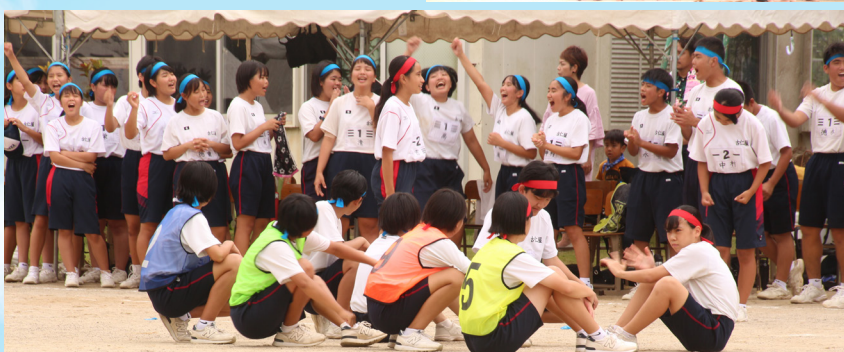
応援席からは終始大声援が送られた