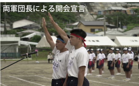
両軍団長による開会宣言

新型コロナウイルス感染防止のため、プログラム内容の一部削減、参観者の人数制限、手洗い・消毒の時間を設ける等感染症対策を万全にして行われた今年の古中体育祭。 しかし、そこには、コロナ禍に負けない中学生達のたくましく躍動する姿、そして、たくさんの笑顔と汗が輝いてました。古仁屋中学生が創りあげた「青春の1ページ」ぜひご覧ください！