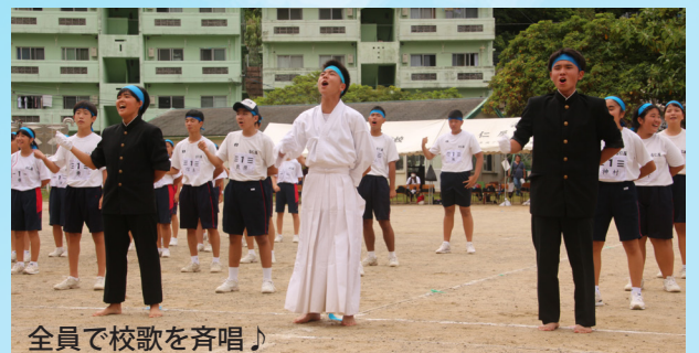
全員で校歌を斉唱♪