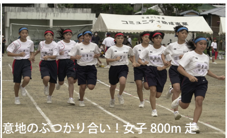
意地のぶつかり合い！女子800m走