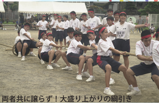
両者共に譲らず！大盛り上がりの綱引き