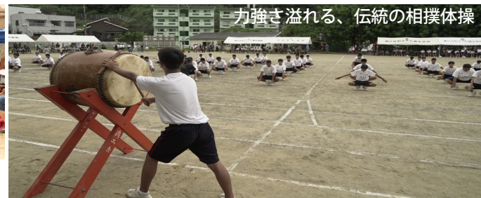
力強さ溢れる、伝統の相撲体操