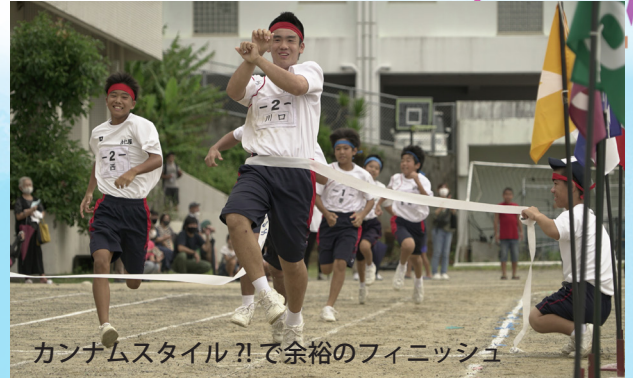
カンナムスタイル?!で余裕のフィニッシュ