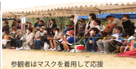
参観者はマスクを着用して応援