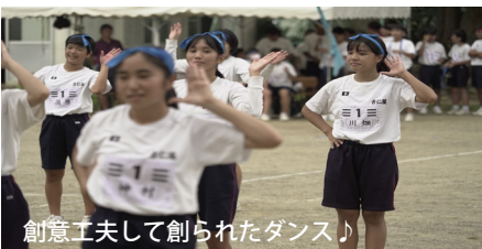
創意工夫して創られたダンス♪