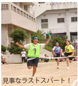
見事なラストスパート！