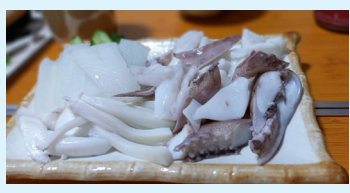
刺身で美味しくいただきました

優勝は「大湊・須手・手安チーム(1時間18分13秒)」。なんと27年ぶりの優勝でした。前回タイムを8分10秒も縮めて躍進賞も受賞しました。大湊須手手安の皆さん、感動をありがとうございました。 出走中たくさんの方から声援を送っていただきました。その一声一声がとてつもなく力になりました。来年こそは、優勝して渾身のガッツポーズができるように鍛えなおしたいと思います！ それでは、3月も皆さんにとって充実した幸せな日々でありますように。