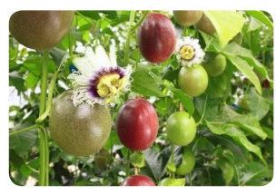
パッションフルーツ