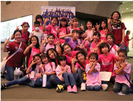
↓昨年度のヤングアメリカンズ in 鹿児島の様子

この事業は、ヤングアメリカンズ合は、瀬戸内町教育委員会により審査を行い、参加者のみ通じたいしますの交流活動を通して豊かな感性や国際的感覚を養うこととで、次世代の瀬戸内町を担う青少年リーダー育成に寄与することを目的として実施しています。 2020年の鹿児島会場日程は、令和2年6月26日(金)～6月28日(日)の3日間で、最終日28日(日)のショーは、16時開場16時30分開演です。 申込様式は、社会教育課または、瀬戸内町ホームページからダウンロード可能です。 ■助成金額 18,000円 一人につき ■申込方法・申込期間 参加申込書に必要事項を記入し令和2年4月22日(水)までに社会教育課へ提出してください。 ■対象 瀬戸内町在住の小学5年生から高校3年生まで(令和2年4月末日現在) ■定員 25人程度