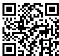
↑大会公式HPはこちら

■参加料 一般…1万円 小中高校生…5千円 ■定員 300艇※先着順 ■エントリー方法 ①公式ホームページからの申込②エントリーセンターへFAX・郵送 ③商工観光課にて直接申込