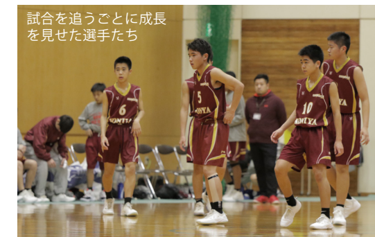
試合を追うことに成長 を見せた選手たち