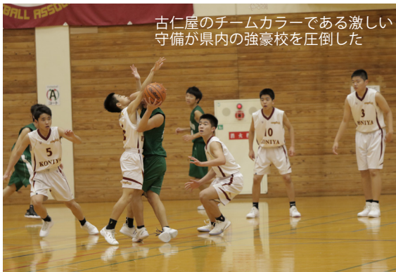
古仁屋のチームカラーである激しい 守備が県内の強豪校を圧倒した