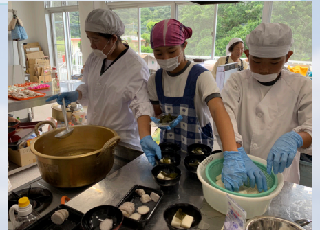
(実際の調理の様子)