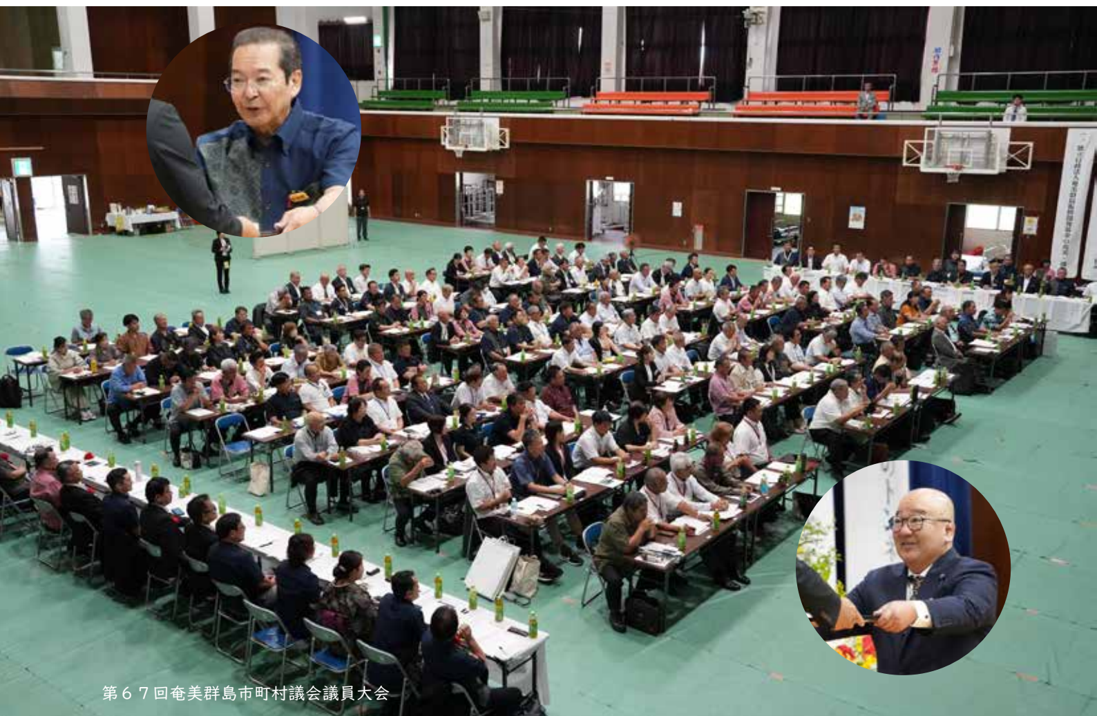
第67回奄美群島市町村議会議員大会

発行／鹿児島県瀬戸内町議会 編集／議会報編集委員会 〒894-1592 鹿児島県大島郡瀬戸内町古仁屋船津23番地