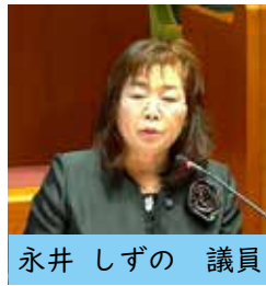
永井 しずの 議員

個人作成のガイド資料等は、可能であれば提供いただき、各待ち合い所への設置を含め有効に活用したい。町制施行70周年を機に、地域に希望を与える支援に努めます。