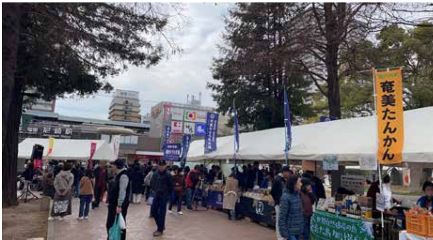
尼崎物産展の様子

説明することで町への理解と共感が深まり、新規寄附獲得やふるさと納税増に繋がった。来場者に対し、町の魅力を発信することで将来的なりピーター確保が見込まれる。近隣市町村との合同開催は現段階では予定していないが集客増や相乗効果も見込めるため、調査・研究をしていきたい。