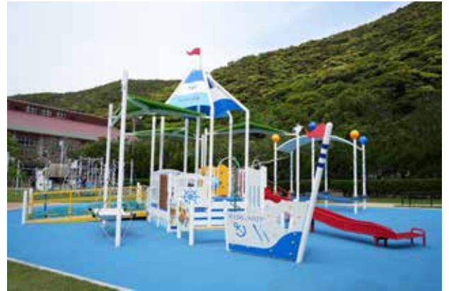
4月3日にリニューアルされたすいすい広場