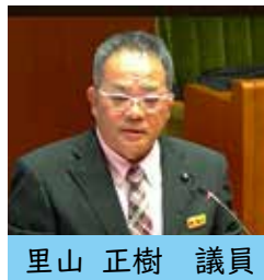
里山 正樹 議員

答 町としてできる限りの支援策を講じておりますが、見直し等につきましては、学校評価アンケートの検証結果や、生徒・保護者からのニーズ、古仁屋高校を応援してくださる地域の方々の声を的確に捉え適正に判断してまいります。