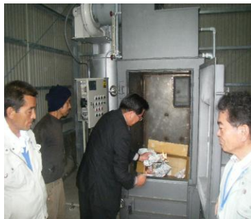
火入れ式を行う関係者

4月23日、小型焼却炉の火入れ式が与路島で行われました。この施設は、特定離島ふるさとおこし推進事業で設置され、地区住民の方々が長年待ち望んでいたものです。焼却炉の稼働により島内すべての可燃物係ゴミの処理が可能になり、現在稼働中の生ごみ処理施設との併用により、ダイオキシン問題等安全かつ衛生的に処理ができ、有人島をかかえる本町のモデル地区として貢献できるものと今後に期待が持てます。