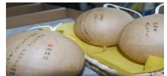
価 格 表