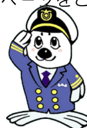
当庁イメージキャラクター 「うみまる」

http://www.kaiho.mlit.go.jp/saiyou/bosyu/index.html