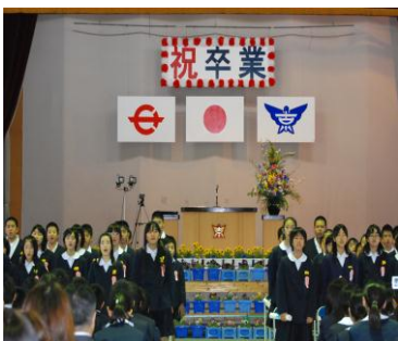
卒業生別れの言葉

3月24日、古仁屋小学校（村田達治校長）で、平成21年度第62回卒業式が行われました。60人の卒業生を前に、PTA会長は「人間は一人では生きていけない動物。新たな出会いを大切に、信頼できる友人を作って」と中学校生活へのアドバイスを送り、保護者代表は「卒業を一緒に迎えるはずの友達が一人足りないので残念。命の大切さを知り、友人の分もがんばって」と励ましの言葉を述べました。