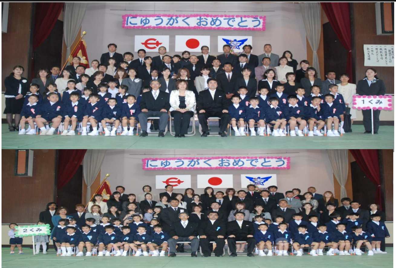
古仁屋小学校へ入学した児童・保護者等