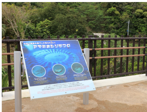
↑アアミホシゾラフグの紹介も