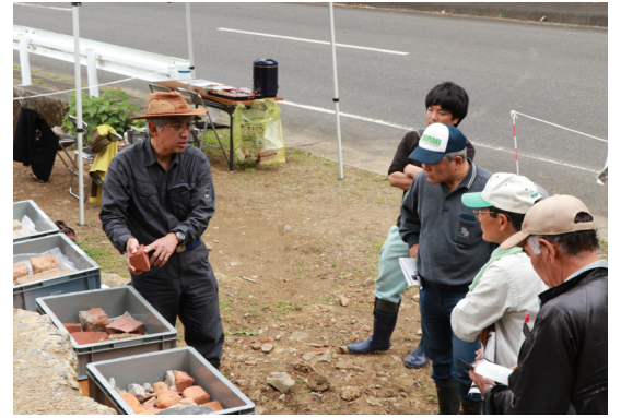
↑施設で収集されたレンガの説明