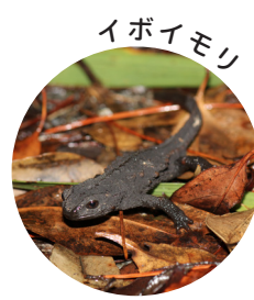
増えたミミズを食べて繁殖