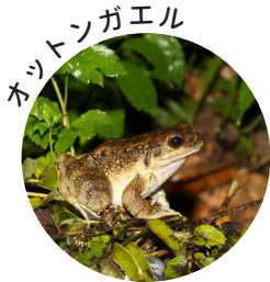
水量が増した水辺で繁殖