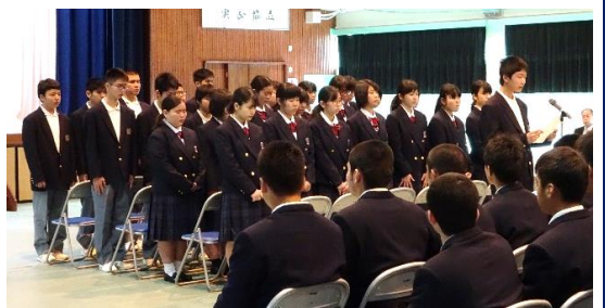
↑ 在校生と初めて対面する新入生 (入学式後の対面式) ↓ 入学式後、初めてのLHR