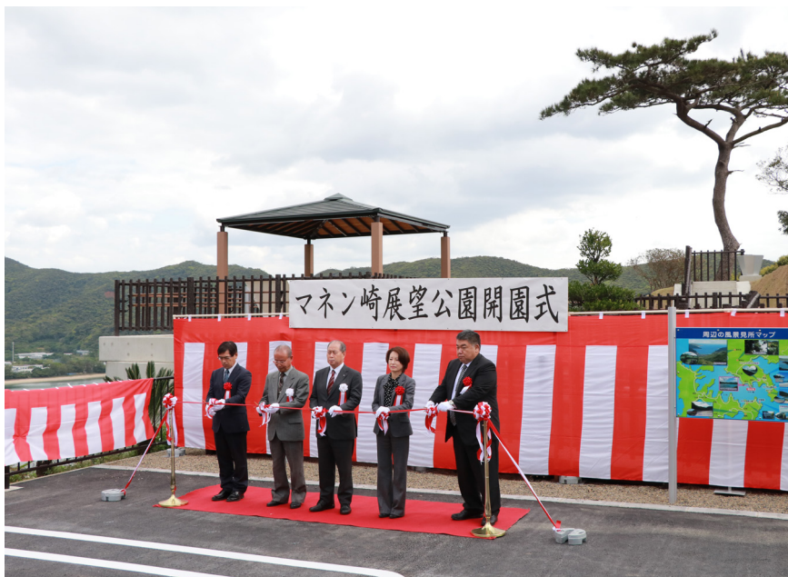
↑マネン崎展望公園開園式テープカット

嘉鉄集落のマネン崎展望公園開園式が開催され、県や町、工事、集落関係者など約30人が出席しました。マネン崎展望公園整備は、県の魅力ある観光地づくりの一環で、にぎわい回廊整備事業として実施されました。事業費は、約1億1千万円。