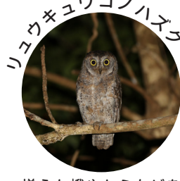
増えた蛾やセミなどを食べて繁殖・子育て