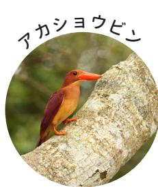
カニ、カエル、トカゲ、魚類などを食べて繁殖