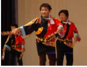
「河内おとこ節」(篠川)

1月19日、清水総合体育館で「いきいき活動、増やそう仲間」をテーマに、第30回瀬戸内町老人クラブ交歓大会が開催され、町内各地域から会員約400人が集い、健やかな長寿社会における老人クラブの役割について共に学び、交流を深めました。