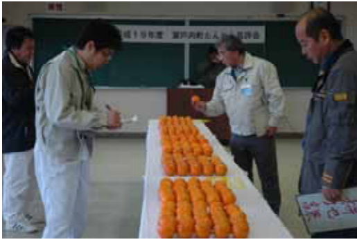
入念に審査が行われました

奄美たんかんの生産振興と高品質果実生産による銘柄の確立のほか、町内果樹部会員の目標を達成・生産意欲の向上を図ることを目的に、初めて開催された品評会には、124人の果樹部会員のうち、8人の生産農家が「垂水1号」のし玉を出品、審査は玉揃いや果形、果皮などの外観と、糖度や酸の測定による内容について行われ、総合点で競われました。