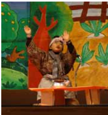
保健福祉課職員も熱演!