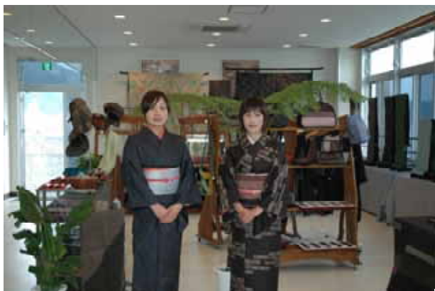
「海の駅」2階の大島紬展示コーナー