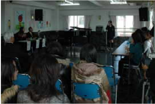
観客が見守るなか行われたオーディション

オーディションには、4人の女性が応募、審査は50人余りの観客が見守る中、それぞれが選んだ曲を順番に2曲ずつ歌う、歌唱テストにより行われました。