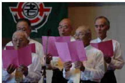
男性陣も活躍しました(勝浦)