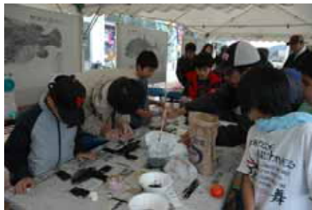
子供たちも魚拓に挑戦