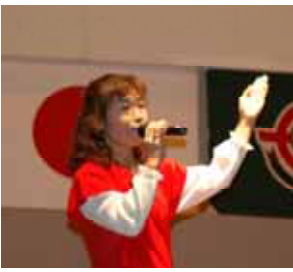
加計呂麻バスガイド風 新民謡「幸せのせて」