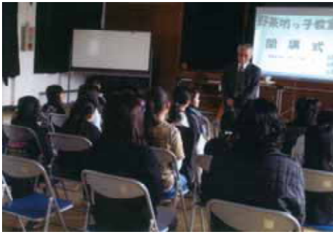
「野茶坊っ子教室」の開講式

野茶坊っ子には約50人の子どもたちが登録し、童子八月踊り研究会、永井・重田三味線教室等の講師の協力を得て、主に八月踊りや鳥唄を学んだり、茶道・華道等の体験をとおして、地域の歴史・伝統文化に対する関心や理解を深めました。