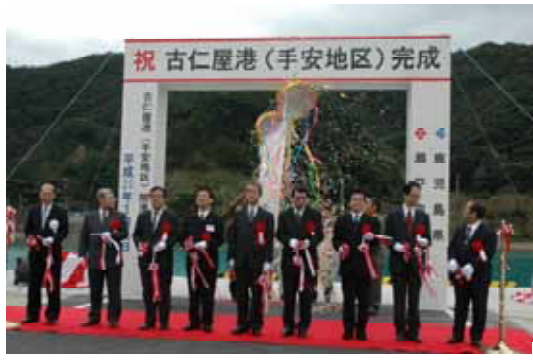
関係者によるテープカットとくす玉開き

このため、水産業拠点の古仁屋港に近く、地形的にも岬や山によって風波の遮断効果が見込まれる静穏な水域を有する手