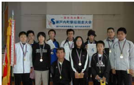
チームワークで優勝した瀬久井西チーム

1月20日、新春恒例の第32回町駅伝競走大会が行われ、13チーム130人の選手たちが、10区間21キロをたすきで繋ぎ、古仁屋市街地を駆け抜けました。当日は、天候にも恵まれました。