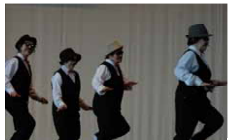
ユーモラスに「ジングスカン」(春日)