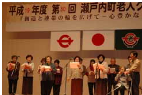
ハーモニカに合わせて(大湊)