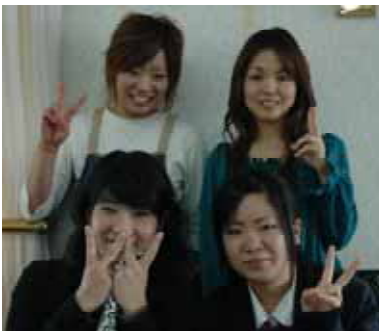
それぞれにすばらしい歌声を披露した4人