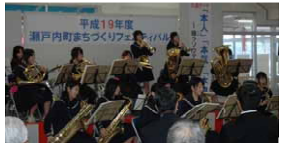
オープニングを飾った古中吹奏楽部