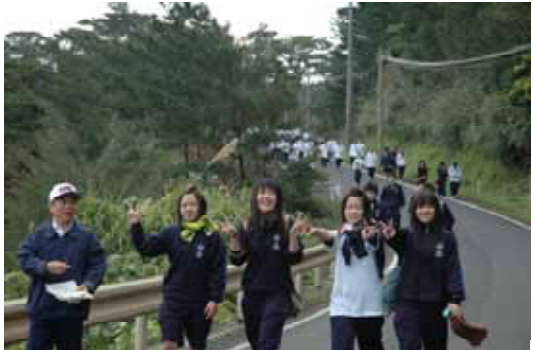
楽しく加計呂麻を練り歩く古高生徒たち 広報せとうち（ ）

14回目となる今年は、1・2年生の116人が参加、生徒たちは、晴天のなか、友達と談笑し、加計呂麻の自然を満喫しながら、生間・呑之浦間の往復23キロを練り歩き、思い思いに楽しんでいました。