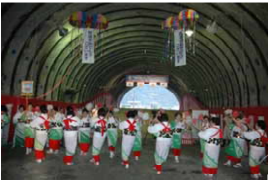
貫通点で披露された網野子アンドンデー

式には工事関係者や集落住民など200人余りが参加、貫通点で清めの儀やくす玉開き、通り初めの儀などが行われ、貫通を祝いました。祝賀会では、勝浦・網野子の両集落婦人会による伝統芸能も披露され、祝典に華を添えました。勝浦トンネルは延長1122メートルで、地蔵トンネル（1065メートル）を抜き、町内最長のトンネルとなります。今後、舗装、照明、取付道路の整備を進め、21年度中に節子集落への町道入口までを一部供用開始する予定です。