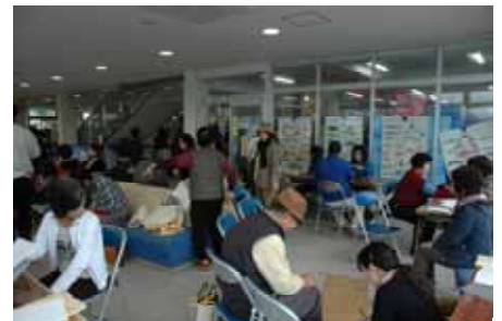
血圧・体脂肪チェック(健康相談コーナー)