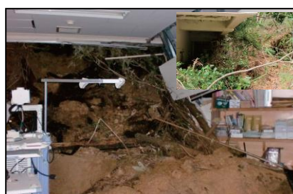
奄美大島南部豪雨被害