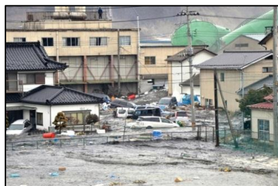
東日本大震災津波被害