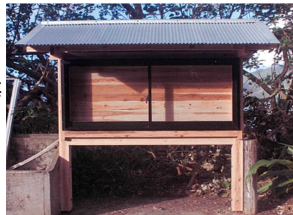
集落掲示板の整備 (勢里集落)