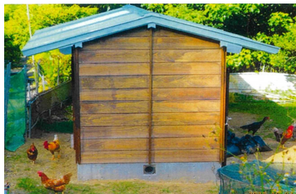
養鶏場の建設(手安集落)