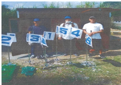
グラウンドゴルフ場の整備 (西阿室集落)