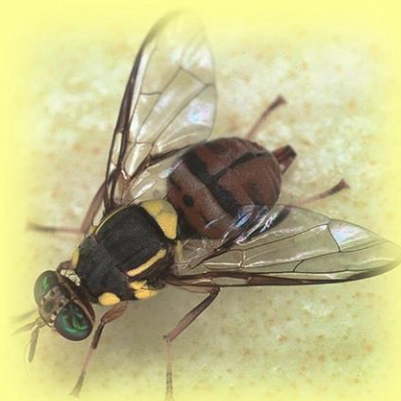
ミカンコミバエ成虫 (体長約7.5mm)