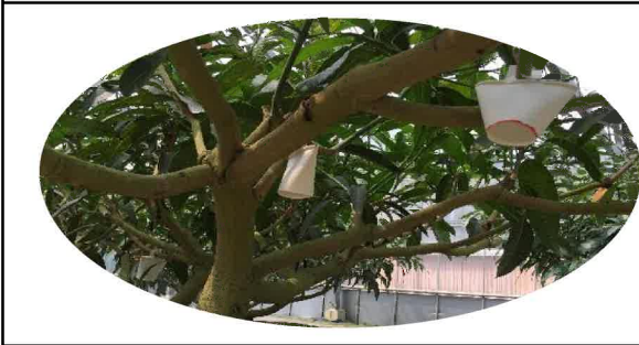
パック製剤のマンゴーへの放飼例