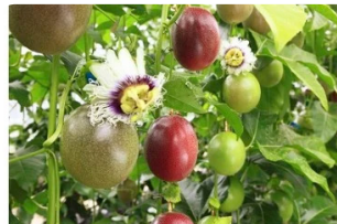
パッションフルーツ