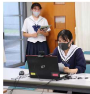
生徒総会・家庭クラブ総会(リモート)(5/27)