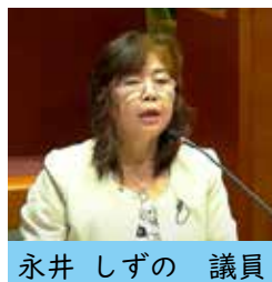
永井 しずの 議員

答 校区ごとの教育懇談会等を通じて、保護者や地域住民と教育上の課題を共有し、コミュニティの核としての学校の性格を踏まえ、地域ので、地域の教育環境全体を見据えて対応します。