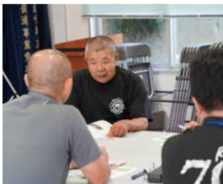
請島の皆さんと話し合いながら 地区防災計画を作成している様子。

これから計画を作ったり、設備の見直し をしたときに、メンテナンスが必要だっ たり何かを新しく購入することもあるか と思います。そんな時に活用できる町 からの支援があると更に助かりそうです ね。