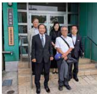
三島村役場前にて