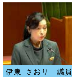
伊東 さおり 議員

答 本町では毎年、瀬戸内町保護司会へ活動補助費として4万円を支出しています。これらの財源をもとに、再犯防止のチラシやのぼり旗などを作成し、啓発活動を行っており、町として支援をしています。