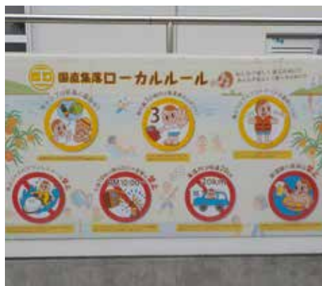
大和村 国直集落の ローカルルール看板

答 危険家屋については、地域の安全や景観に与える影響が大きいことから、重点的な対策が必要であると認識しています。このため、海岸通り付近の危険空き家については特に指導や助言などを行っており、全体としては減少傾向にあります。ただし、一部では経済的な理由から解体が進まない状況も見られます。本町としては、今後も粘り強く交渉や指導を行い、住民の安全確保と地域の景観保全に努めていきます。