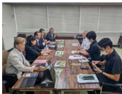
三島村調査意見交換

令和7年10月20日（月）に三島村役場の村営みしま焼酎「無垢の蔵」の調査を行いました。