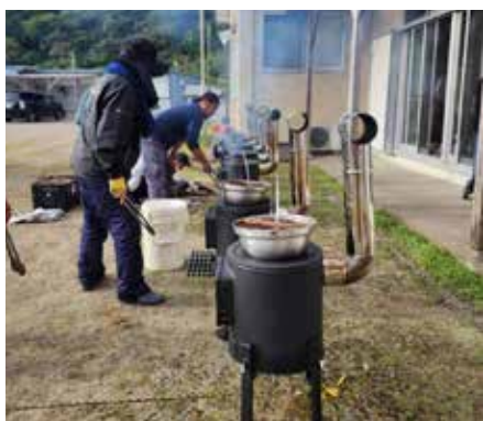
支援事業を活用して購入した薪窯。 集落作業では作業班と炊き出し班に 分かれて定期的な訓練をしている。

例えば勝浦集落ではこの事業を活用 して薪窯を8台購入されています。災 害時に電気、ガスが止まってもキャン プをする要領で炊き出しができます。