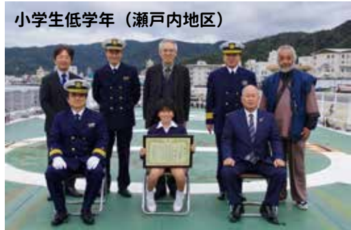
小学生低学年（瀬戸内地区）