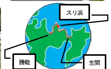
▲今年度のチェックポイント