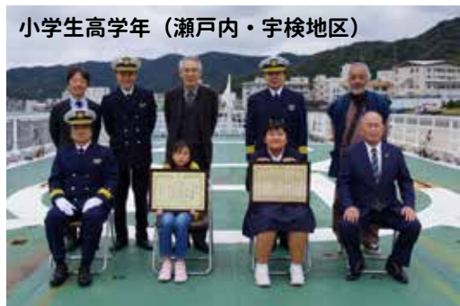
小学生高学年（瀬戸内・宇検地区）

子どもたちに海洋環境保全思想の普及を図るとともに、海上保安業務への理解促進を図ることを目的としており、今回で24回目となります。奄美