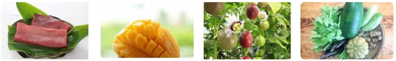
クロマグロ マンゴー パッションフルーツ 旬の島野菜 皇室献上パッションフルーツやマンゴー、クロマグロや旬の島野菜など返礼品も色とりどり♪