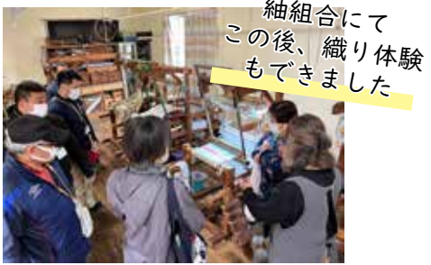
紬組合にてこの後、織り体験もできました