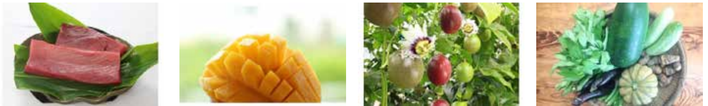
クロマグロ マンゴー パッションフルーツ 旬の島野菜

皇室献上パッションフルーツやマンゴー、クロマグロや旬の島野菜など返礼品も色とりどり♪