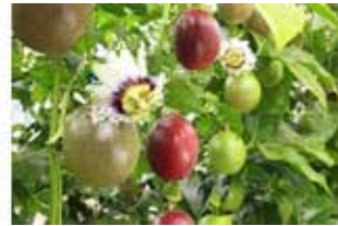
パッションフルーツ