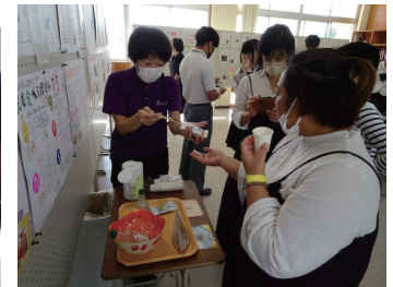
理科 昆虫食&世界自然遺産