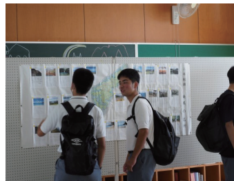
2年総探 奄美の名所