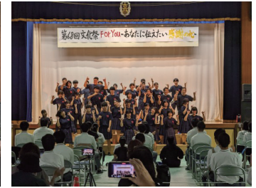
2学年 ダンス ダンス ダンス!