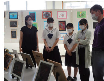
家庭クラブ・書道 作品展