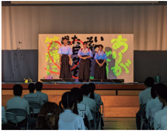
書道パフォーマンス

10月30日(日)に、文化祭が開催されました。本年度も新型コロナウイルス感染症対策のため、入場者を制限しての実施となりました。ステージ部門では、ダンスや日常を題材とした劇、書道部のパフォーマンス、音楽選択者や吹奏楽部による楽器演奏、手話コーラス、有志団体による歌やダンス、空手などで、会場を盛り上げました。展示部門では、フォトスポット、美術同好会による階段アート、家庭クラブや書道選択者による作品展、総合的な探究の時間(総探)や理科など授業の成果発表などがあり、ご来場者楽しんでいただきました。