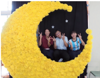
1学年 フォトスポット