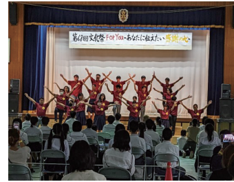
3-1 TV time!