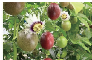
パッションフルーツ