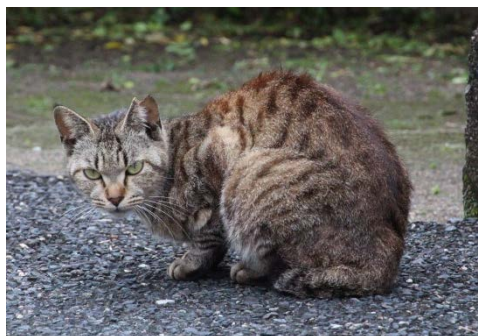
左耳カットはメス

瀬戸内町では、飼い猫条例の制定や飼い猫の不妊手術助成、野良猫のTNRなどを実施して、望まない猫の増加抑制対策を行っています。