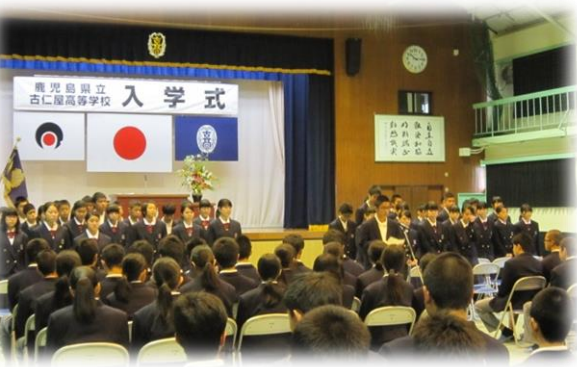
在校生と初めて対面する新入生(入学式後の対面式)