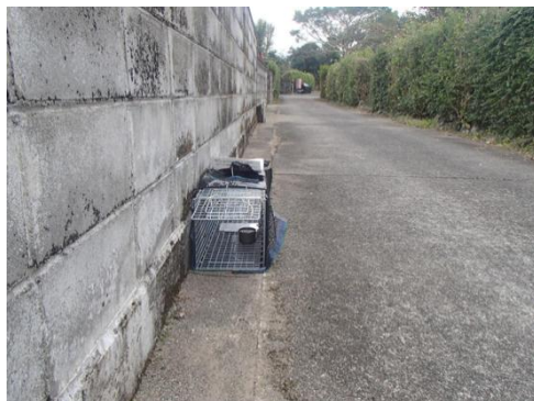
▲平成28年2月から3月までの期間内に2回のTNRを実施し、合計15匹の野良猫を不妊手術しました。