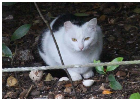
右耳カットはオス