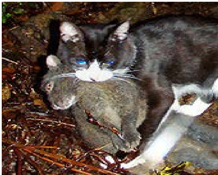
アマミノクロウサギを捕食するノネコ