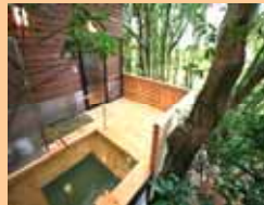
天珠の館 露天風呂

粒子線治療は、一日の治療時間が30分程度で済みます。そのため、治療以外の時間を快適にお過ごしいただけるよう、様々な体験活動を行っています。近隣の施設において、月1回開催される陶芸教室では、初心者でも簡単にできるお皿や抹茶碗など陶芸物をお創りいただいています。また春には、お茶摘み体験へもご案内をしており、参加された皆さん一様に楽しんでおられます。さらに、隣接する宿泊施設「天珠の館」には、温泉スパ施設や健康増進をサポートする運動施設、遊歩道も整備されています。治療中はふさがちな気持ちを癒していただける施設です。