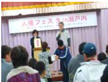
抽選会・たんかんゲット

農産物や魚介類、加工品の販売や昔の遊び道具作り、八月踊り体験、消防のはしご車試乗、地女連等によるフリーマーケット、バザーコーナーなど、来場者を楽しませました。お昼からは、講演会が行われ終了後、伊勢エビや朝日ガニ、たんかん等が当たる抽選会を開催。抽選番号が呼ばれる度に歓声があがりました。