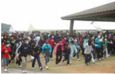
ウォーキング大会スタート

大島海峡満喫(6キロ)チャレンジ(11キロ)の3コースに約230人が参加。景色を楽しみながらマイペースでゴールを目指しました。「海の駅」講内では、展示コーナーや健康相談コーナーが設けられ、健康相談コーナーには、多くの人が訪れていました。