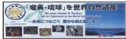
瀬戸内事務所駐車場にある啓発看板

世界遺産の登録や危機遺産の保護などを話し合うために、毎年6月頃に開催されています。平成27年(2015)の第39回世界遺産委員会は、ドイツのボンで開催されました。次回(今年)第40回の開催地は、トルコのイスタンブールが予定されています。