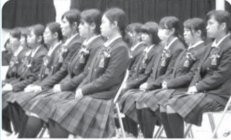
式辞等を聴く卒業生 3年1組 普通科 (男子17名 女子18名 計35名)