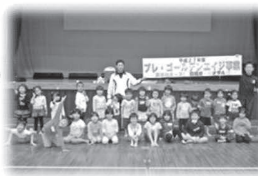
27年度第9回集合写真