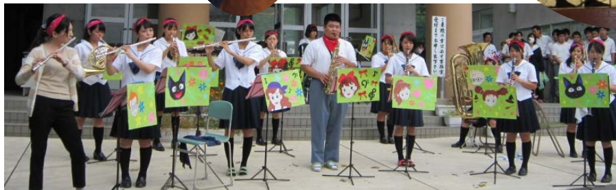
吹奏楽部野外コンサート