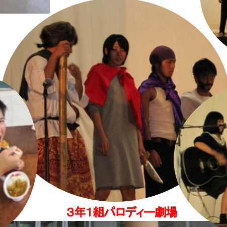
3年1組パロディー劇場