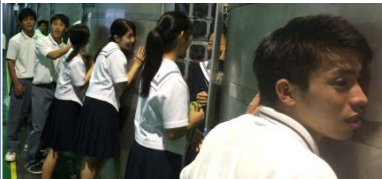
奄美大島開運酒造で黒糖焼酎の音響熟成に興味をもつ生徒たち

11月17日(火)に1年生44名が、企業見学・郷土研修で近畿大学水産研究所奄美実験場と奄美大島開運酒造を訪れました。1日という短い期間でしたが、生徒たちは普段なかなかすることのない体験ができ、郷土奄美の魅力を再確認できるいい機会となりました。