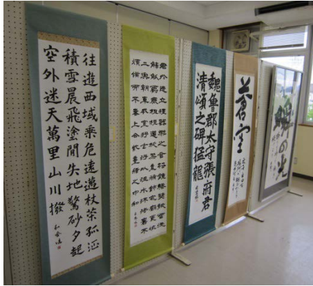
書道部による展示作品

10月31日(土)に第61回文化祭を行いました。「わーきゃの島のかるちゃーふえす」というテーマのもと、クラス、部活動、有志団体それぞれが素晴らしい展示発表・ステージ発表を行い、会場を大いに盛り上げました。また、当日は多くの保護者や地域の方々に来場していただき、活気のある文化祭となりました。来場して下さった方々、誠にありがとうございました。