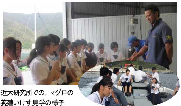
近大研究所での、マグロの養殖いけす見学の様子