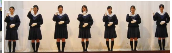
3年生手話コーラス