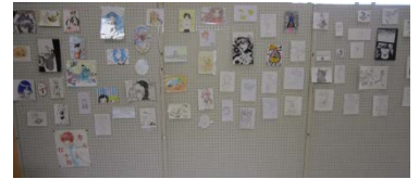
美術同好会による展示作品