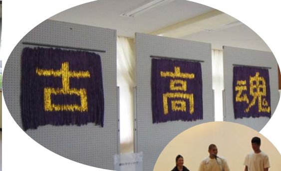
1年1組折り鶴アート