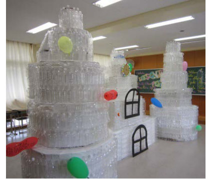
1年2組ペットボトルアート