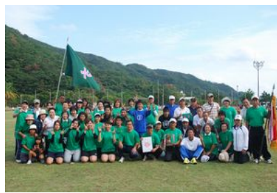
大会3連覇 東方チーム