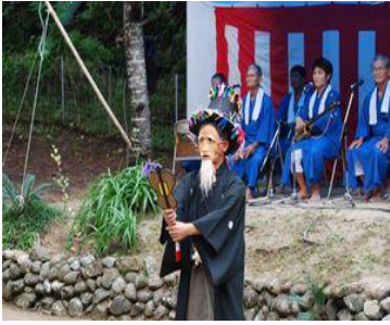
口上を述べるサンバト

行われ、演目順は、最初と最後以外決まりが無いので、年によって、順番が違います。今年の順番は諸鈍長浜でシユンハナツカイ(みそぎ)を行い、第一部「楽屋入り」「サンバト」「ククワ節」「シンジョウ節」「キンコウ節」「スクテングワ」第2部「シシキリ」「ダットドン」「カマ踊り」「タマティユ」「高キ山」でした。昨年会場の都合で、公演できなかった「タマティユ」も行われ、全11演目が行われました。