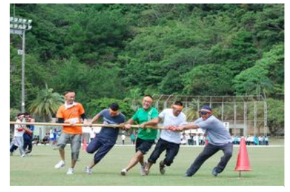
内と外どちらもキツイ