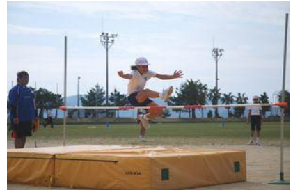
5年生 女子走り高跳び