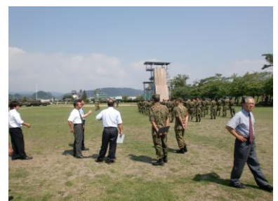
国分自衛隊を視察する委員