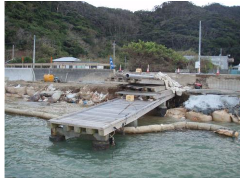
船着場改修が望まれる武名棧橋