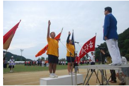
山郷代表 選手宣誓

今年採点外種目として、小学生が封筒の中に入れて書かれた指令を実行する「うんめい」が新種目として加わり、選手たちはとまどいながらも笑顔で楽しんでいました。 また、昨年から始まった「増殖リレー」「一輪車競争」「親子仲良く」の3種目は、昨年の経験を踏まえ、早めに選手選考し、練習を始めたようです。