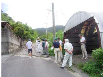
現地調査を行う総務経済委員 (高丘地区)

篠川集落及び高丘自治会より出されてきました3件の陳情を7月7日に現地調査を行い、地域住民の安全安心のため緊急に対処する必要があるとの結論に達し、全会一致で採択と決定しました。