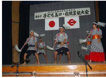
阿木名小中学校 棒踊り

10月31日、町中央公民館で第4回子ども島口・伝統芸能大会が開催され、町内15の小・中学校（181人）が参加し集落の高齢者に指導された島口を披露しました。