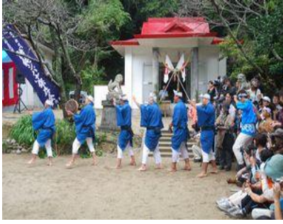
みそぎを終え、楽屋入り

10月26日、国の重要無形民俗文化財指定の「諸鈍シバヤ」が、大屯神社の境内で行われました。時折小雨のちらつく天気の中、会場を埋め尽くした三百人余りの観客の前に、八百年にわたる受け継がれてきた十一種の演目が披露され、町内外問わず、多くの観客を魅了しました。