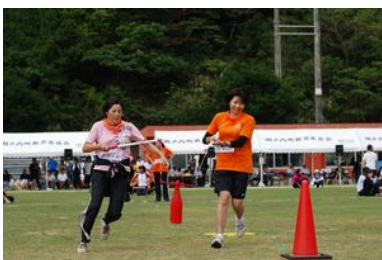
二人の呼吸はバッチリ