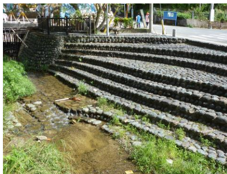
仲里川に整備されている親水施設（古仁屋小学校前）