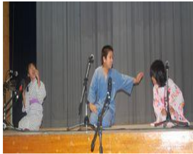
押角小学校 創作落語

角小学校が、伝統芸能の部で、「三味線・島唄」を披露した篠川小中学校が最優秀賞を受賞しました。