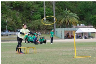
練習の成果を披露