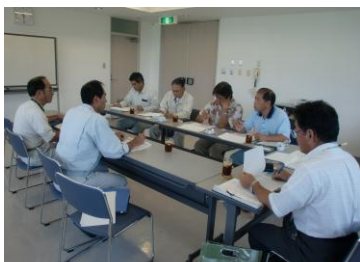
調査を行う文教厚生委員 (名瀬クリーンセンター)

同センターは奄美市他、龍郷町、大和村、宇検村で衛生管理組合を組織し、加入市町村は分担金によって管理運営されており、本町は処分手数料を支払うのと合わせて、同センターに4名の職員を