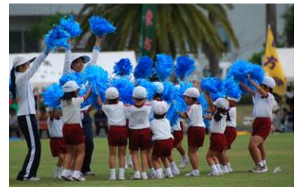
園児がかわいい踊りを披露