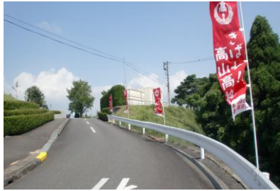
通学路沿いにのぼり旗が はためく高山高校

三、町長を会長とする「古仁屋高校存続協議会（仮称）」を設立し、常に古仁屋高校をはじめ「古仁屋高校を支える