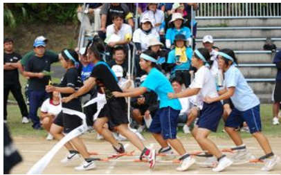
足を揃えて余裕のゴール