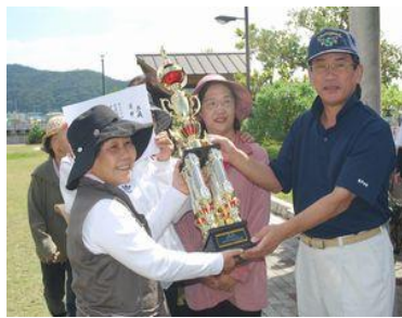
優勝の阿木名わくわくチーム

この大会は、地女連の親睦を図るため、会長が企画し、趣旨に賛同した町長がトロフィーを寄贈し立ち上げました。参加約50名、8チームで争われ「阿木名わくわく」チームが栄冠を手にしました。