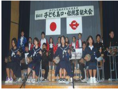
4連覇達成 篠川小中学校

島口の部7校、伝統芸能の部8校で競われた演目でしたが、島口の部で「よもぎもち こわい」の創作落語を披露した押