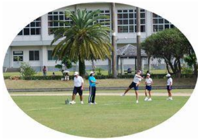
6年生 女子ソフトボール投

10月14日、清水公園陸上競技場において、本町の5・6年生全員による陸上記録会が行われ、多数の父兄が声援を送るなか、児童達の奮闘が見られました。