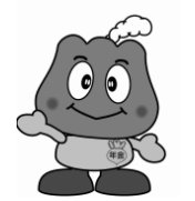
年金キャラクター「もくもく」