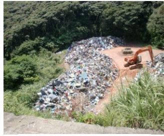
最終処分場の現状 (節子地区)