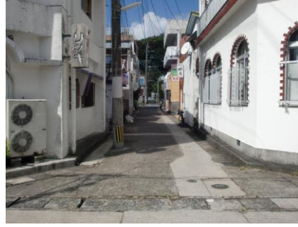
春日地区社交街通り