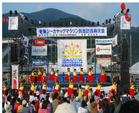
瀬戸内のフラガール