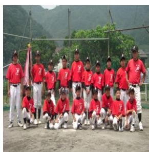
優勝したファイターズ

6月14日、県スポ少競技別(野球)交歓大会大島地区予選大会が、奄美市輪内球場で行われました。朝日野球SPとの決勝戦は、先取点を取った瀬戸内ファイターズが押し気味に試合を進めますが、地元球場の利を生かした朝日野球SPが終盤に逆転、苦しい試合展開になりますが、最後は下位打線の連打でチャンスを作り、主将の一打で逆転勝利をあげました。優勝した瀬戸内ファイターズは、7月開催される県スポ少競技別交歓大会へ、北大島代表として出場します。