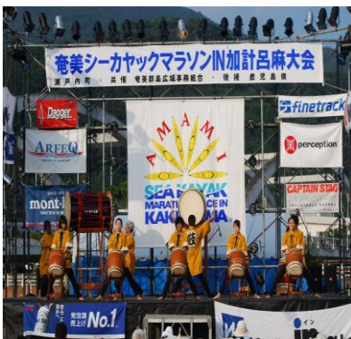
オープニングホノホシ太鼓