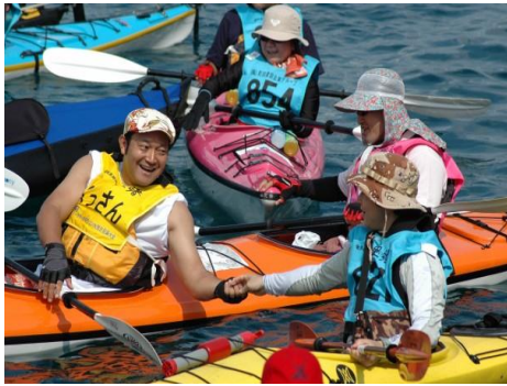
出発前に健闘（完漕）を誓い握手

鹿児島気象台から、奄美地方が梅雨明けしたと思われると発表された7月5日、大島海峡を舞台に、「2009シーカヤックマラソン in 加計呂麻」大会が開催されました。大会には、関東から九州、沖縄に至るまで289艇、441人がエントリーしました。大会前に心配された天候は回復し（安全面を考慮し一部コース変更）、予定通り9時30分から順次、部門別にスタート、参加者は11部門に分かれ、それぞれの思いを胸に大島海峡へ繰り出しました。