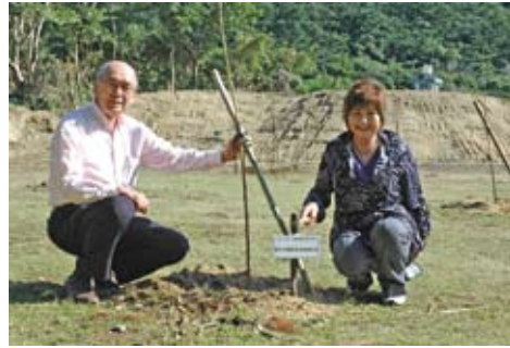
富山丸の遺族会も駆けつけました

県外からも、富山丸遺族会が、奄美の海を望める地に100本の桜を植樹し、今後はこの桜の丘に集うことを約束していました。数年後の二月の清水公園は、全国で最も早く桜の花が舞い踊る花見の名所になっていくのではないのでしょうか。