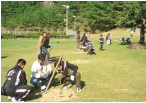
大きく育ちますように

「桜のオーナー」植樹式、12月7日、「桜のオーナー」の植樹式が清水グラウンドで開催されました。「桜のオーナー」制度は、住民主体のまちづくりを進める一環として、20年10月から400本の桜のオーナーを募集したところ、定員の全てが埋まり、空き待ちが出るほどでした。