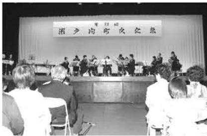
古仁屋中学校吹奏楽部の演奏

水総合体育館で第33回瀬戸内町文化祭が開催されました。作品展示・発表では、絵画や陶器、書道作品や生け花などの作品や児童生徒の学習活動の成果等が展示されました。また、舞台発表では、舞踊やピアノ、島唄、社交ダンスなど、各種教室等での学習成果を発表し、観客を魅了しました。