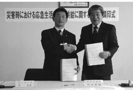
互いに災害協力で連携を

（社）鹿児島県LPガス協会奄美支部と災害協力協定の調印が行われました。大規模災害が発生した場合、二次災害の防止とガスの安定供給に努め、被災した方々の安心と安全を確保するための連携協定を締結し、今後の協力について意見交換を行いました。