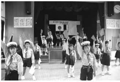
手旗で全国大会へ再び

海洋少年団は、海に親しみながらも児童生徒の健全育成を目的とする全国的な組織で、本町でも昭和52年には全国大会の「手旗の部」で優勝するなど活発に活動していましたが、近年児童数の減少で廃れていました。