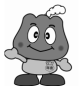
年金キャラクター「もくもく」