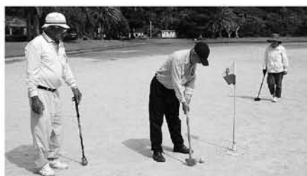
健康づくりがますます重要に！

二十一世紀の本格的高齢社会への対応、また、様々な変革の時代への対応が急務となっております。