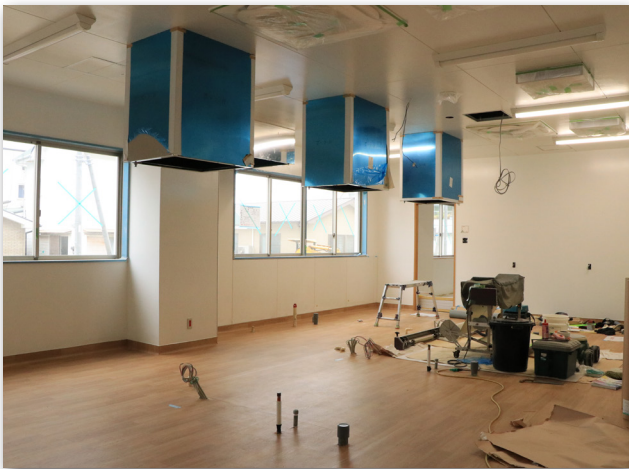
1階炊出し室（平成30年3月19日）