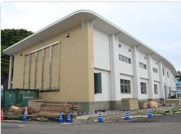
西側外観（平成30年3月19日）