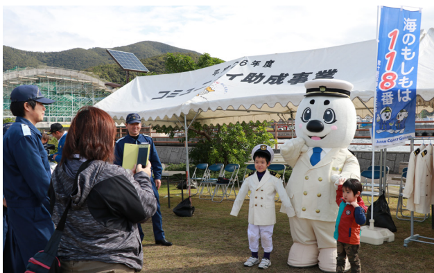
海上保安署制服の試着