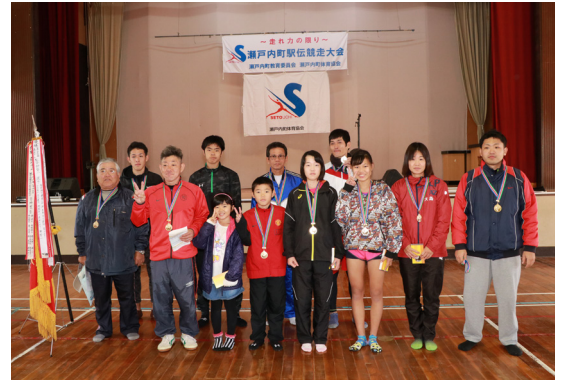
↑3年ぶりに優勝した瀬久井西チーム