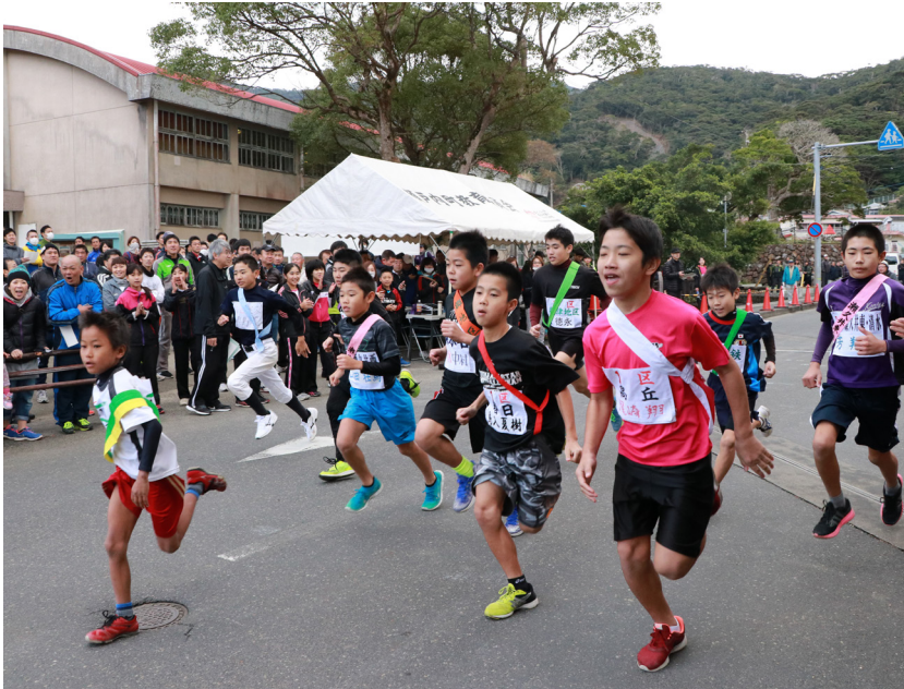
↑古仁屋小学校前から一斉にスタートする10チーム