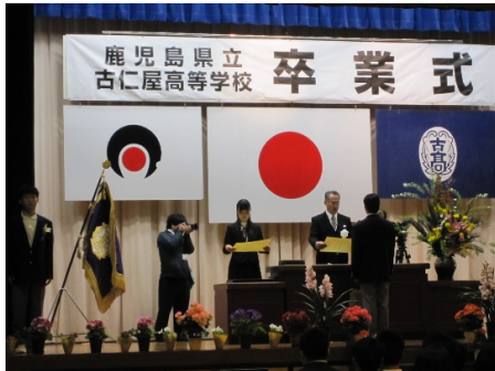
一人一人に卒業証書を授与

男子 20 人、女子 24 人、計 44 人の卒業生が来賓・保護者などの多くの参列者に見守られて古仁屋高校を巣立ちました。卒業おめでとうございます！