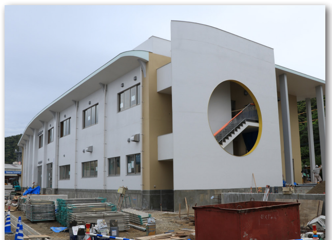
東側外観（平成30年3月19日）