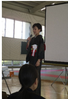
両学級担任より贈る言葉