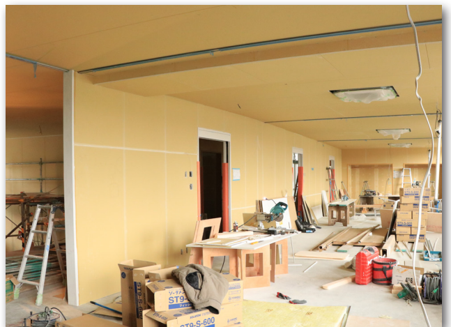
2階交流室（平成30年3月19日）