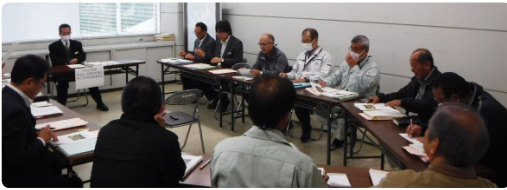
委員会は、自然環境の保全に関する調査・研究を行い、関係団体等と協力連携して「世界自然遺産登録」に向けた様々な取り組みを行うことにより「奄美大島世界自然遺産センター（仮称）」の誘致促進を図ることを目的として平成25年に設置されました。

6月には、世界自然遺産登録の可否決定がなされます。各関係課及び関係機関と連携し、官民一体となって世界自然遺産登録に向けて取り組んで参りますので、町民の皆様のご理解とご協力をよろしくお願いします。