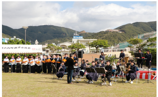
古仁屋中学校吹奏楽部と歌声サークル篠川