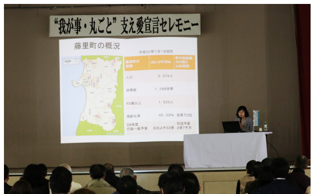
「我が事・丸ごと支え合い宣言」記念講演会