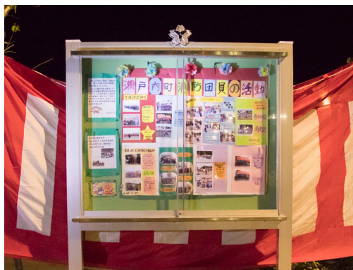
↑ 海の駅駐車場近くに設置した掲示板