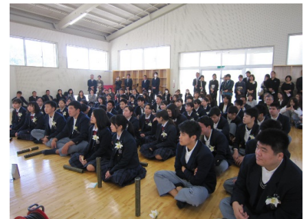
式後の合同ホームルーム