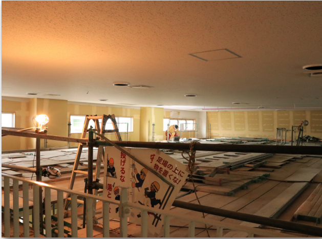
大ホール（平成30年3月19日）