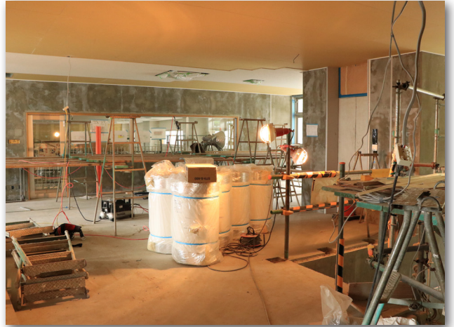
2階ホール（平成30年3月19日）