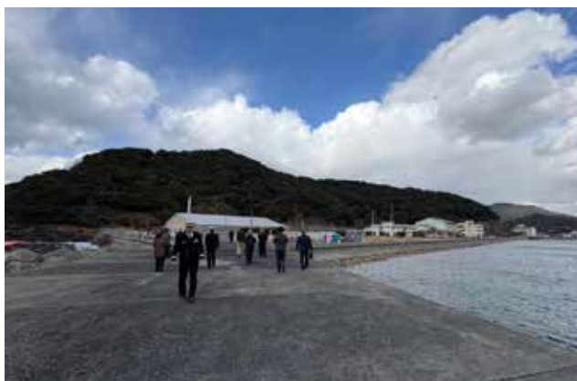
海上自衛隊 下関基地隊の視察

本町に計画している自衛隊海上輸送施設と同規模である海上自衛隊下関基地隊を調査視察しました。 基地内の港湾岸壁、隊舎、宿舎、倉庫、燃料タンク等を案内・説明していただき、本町に計画している施設のイメージが具体化しました。