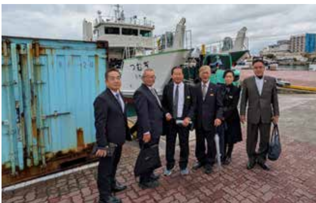
多機能型貨物輸送船「つむぎ」前にて