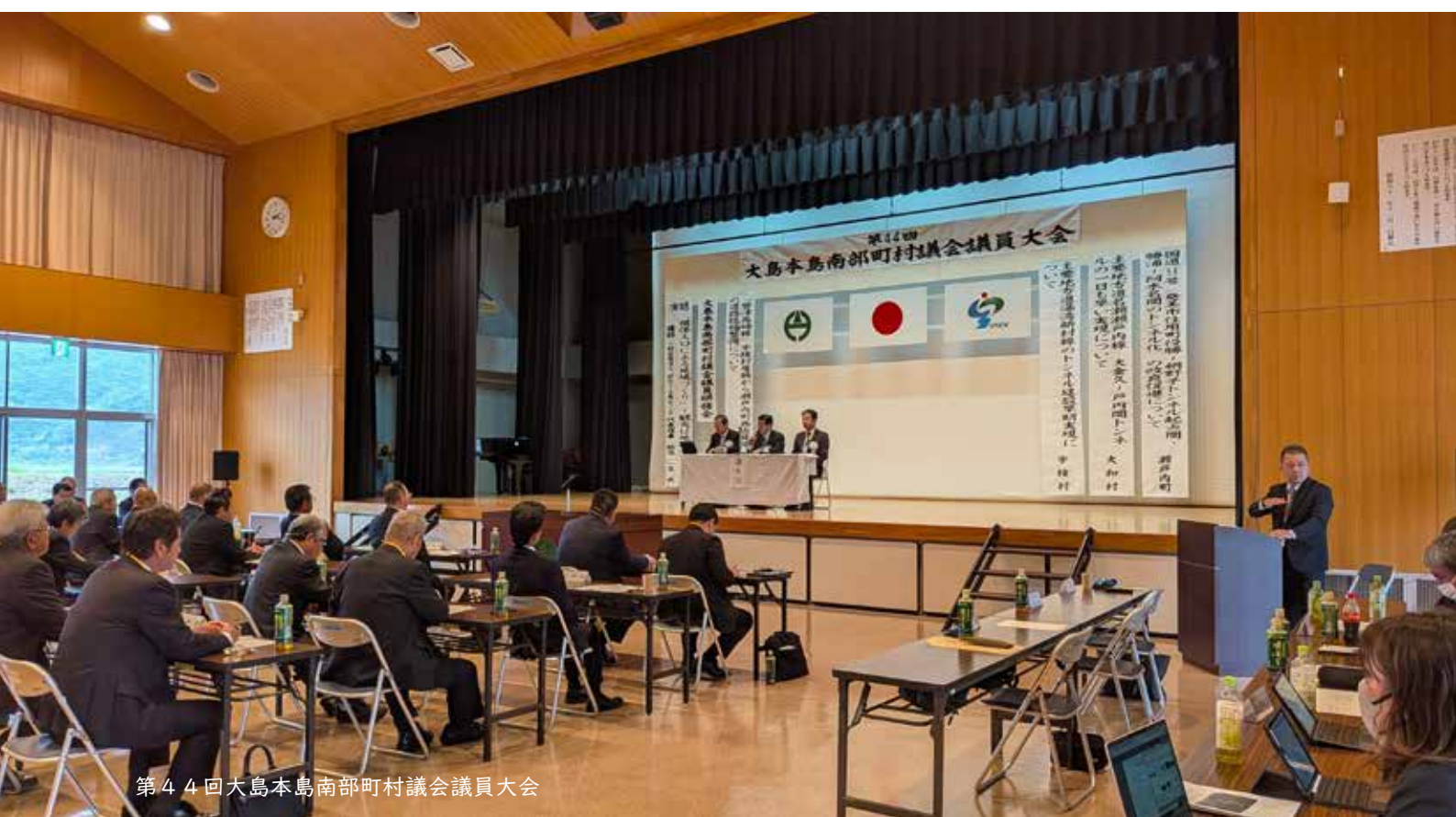
第44回大島本島南部町村議会議員大会

発行／鹿児島県瀬戸内町議会 編集／議会報編集委員会 〒894-1592 鹿児島県大島郡瀬戸内町古仁屋船津23番地