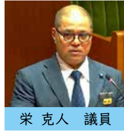
栄 克人 議員

答 小袋は需要が少なく作製が難しい。レジ袋での排出はゴミ散乱の懸念もあるが、住民の要望を踏まえ協議を検討したい。