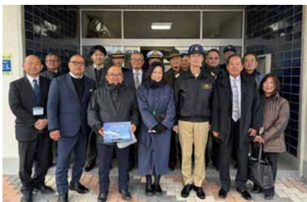
海上自衛隊 下関基地隊のみなさんと

本町に計画している自衛隊海上輸送施設と同規模である海上自衛隊下関基地隊を調査視察しました。 基地内の港湾岸壁、隊舎、宿舎、倉庫、燃料タンク等を案内・説明していただき、本町に計画している施設のイメージが具体化しました。