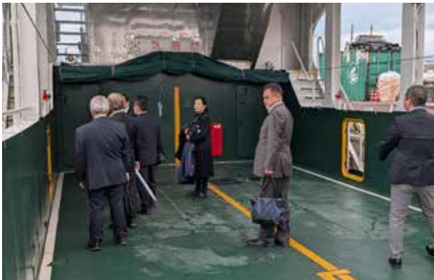
多機能型貨物輸送船「つむぎ」の船内見学

竹富町は「建造費は補助金とふるさと納税で町が持ち、運営費は民間の経営努力で賄わせる（行政のランニングコスト負担を極小化する）」というシビアかつ野心的なモデルです。対して瀬戸内町側は、第三セクターとして行政が運営費を支えるモデルを前提としており、その「自立度」の高さが最大の相違点でした。