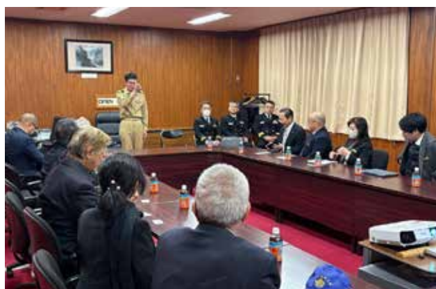
説明・意見交換会