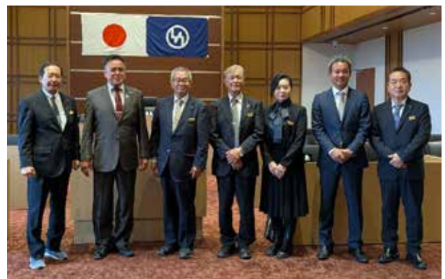
竹富町議会議事堂での集合写真（大久議長と）