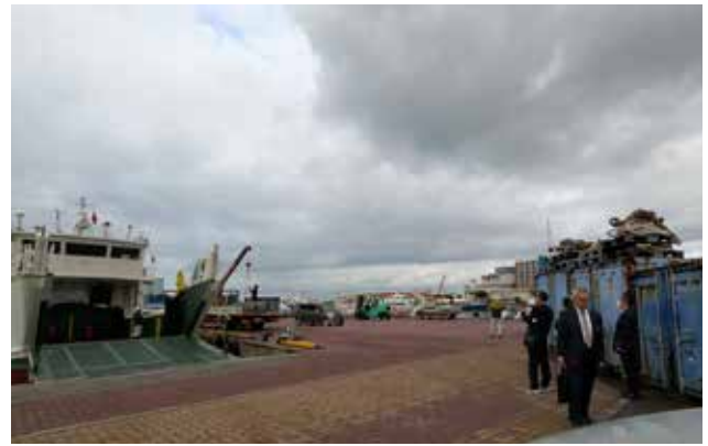
多機能型貨物輸送船「つむぎ」の接岸状況