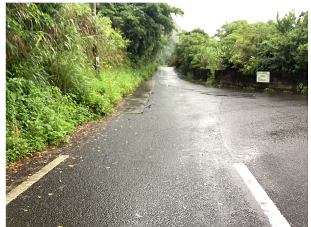
蘇刈集落からホノホシ方面への狭路