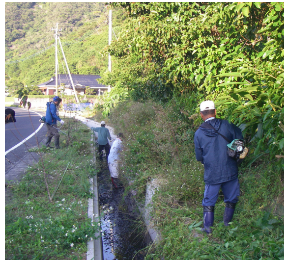
多面的機能支払い交付金事業による活動

により環境整備等、様々な集落の維持対策に苦慮しており、この施策について意見要望があった。今後の集落の維持・存続は喫緊の課題であり、今後の対策について伺います。