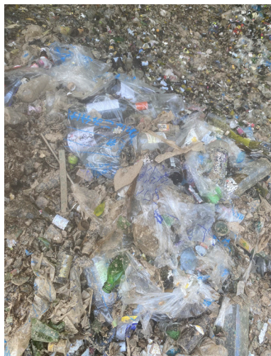
最終処分場に置かれた資源ごみ

います。空きビンを入れる青い袋に「まぜればゴミ分ければ資源」と書いています。町民の方々がこの資源ごみ