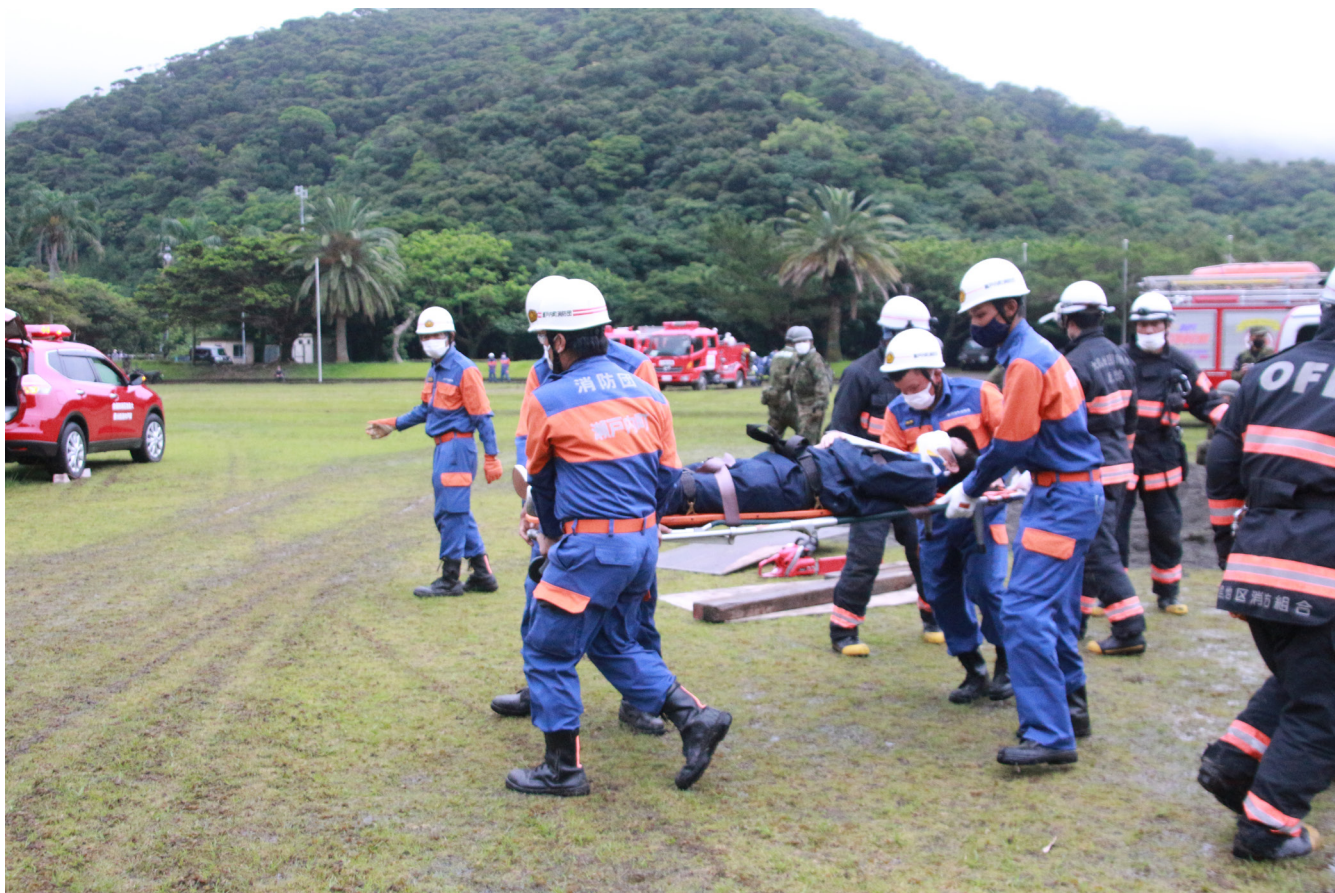
清水運動公園での災害救助訓練

発行／鹿児島県瀬戸内町議会 編集／議会報編集委員会 〒894-1592 鹿児島県大島郡瀬戸内町古仁屋船津23番地