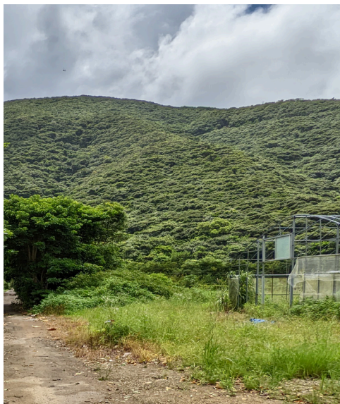
遊休地対策が急がれる農地